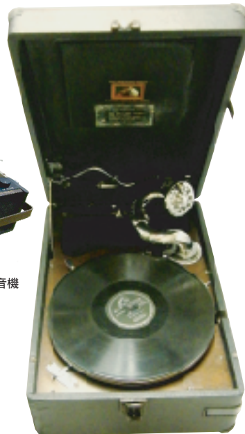
1929年頃のイギリス・グラモフォン社、ポータブル102