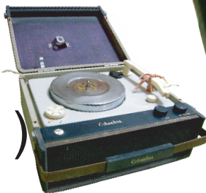
コロムビア製の電気蓄音機

第1部 11:00~ 12:00 昭和の日本の音楽 第2部 13:00~ 14:00 ポップス、シャンソン他 第3部 15:00~ 16:00 ジャズ 各部約10曲の構成で、リクエストにもお応えいたします。各部定員50名(当日先着順)飲み物|水筒、ペットボトルなど持込みできます。禁煙。