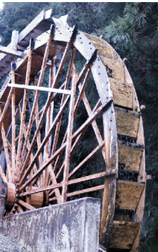
辻子谷の復元水車。

5月25日(日) 9時~15時30分 石切辻子谷の水車跡と 日下・善根寺の旧跡めぐり