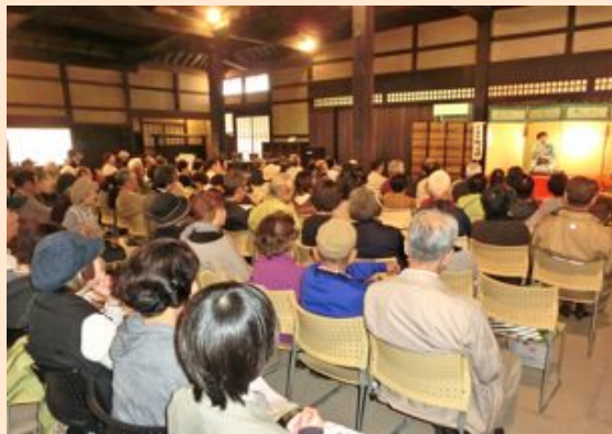
第7回・鴻池新田会所寄席

平成30年 11月3日(土) 祝 開場：12時30分 開演：13時00分 木戸銭・無料